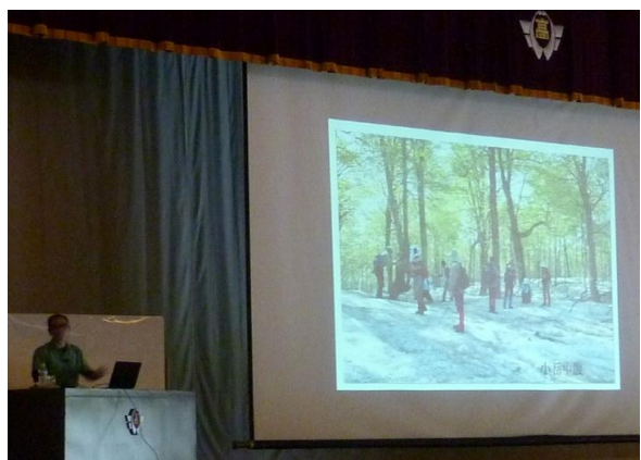
パワーポイントを使って説明

その後、どこからどこまでが白神山地か、白神山地とはブナの原生林、世界遺産の登録基準と白神山地の評価等を説明しました。