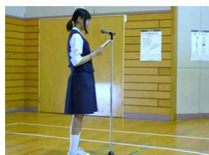
生徒代表 お礼のこぼ