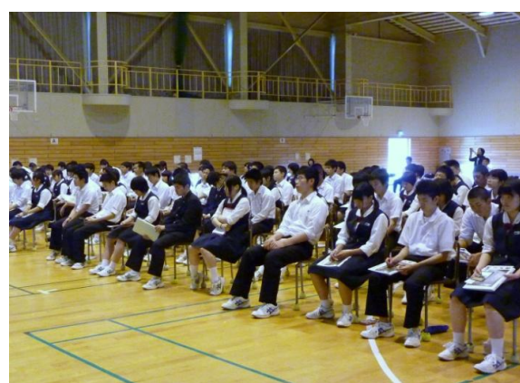
生徒達は熱心に説明を聞いています