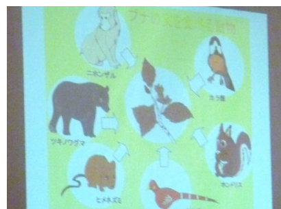
白神山地の動物・鳥類

森は地球の厳しい環境を何百万年という期間をいよし子孫を残してきた結果多くの生き物を産み、その命を育みついで命の環を作ってきた。そのしくみ、命と命がどうつながり、支えあっているのか私たちは今も一皮むかひながらと会話し、学ぼう。森という大きな生物から学ぶことは数限りなくあります。ブナの森では、生もの生命の循環が見事にひとつの無味もなく行われている。生きゆくもの、遊きゆくもの、これが一体である。これだけの生死があるのに、森の中に真実が響くこともない。水はあくまでも清潤だ。この見事さの中にいると、着自体がひとつの生命体のように思われる。環境とはこのようものであると再認識させられる。森の魅力とはまさにこのところで、環境問題にむきまはれている今、学ぶべき題材がここにある。白神の森で、体感体験して、生きる瞬間に感謝しましょう。 白神の森は いにしへの森 いにしへの道