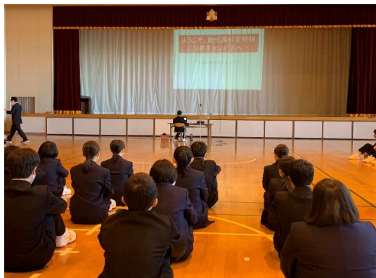
真剣に話を聞く新入生