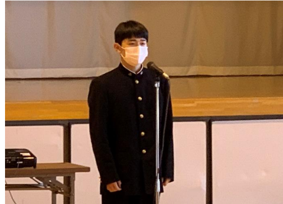
生徒会長の歓迎のあいさつ