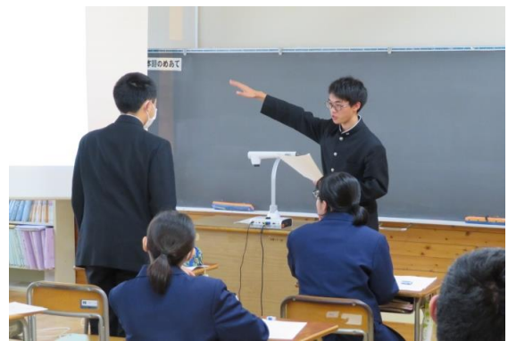
一人ずつ前に出て発表