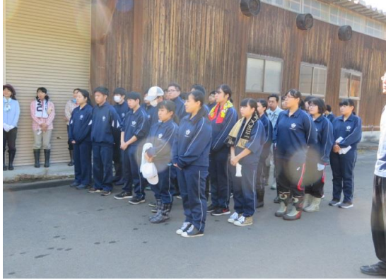
植林の開始式（1・3年）