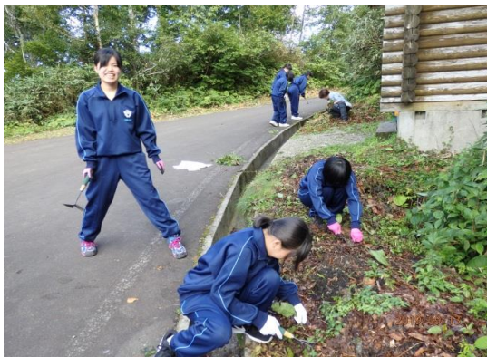
オオバコの駆除（2年）