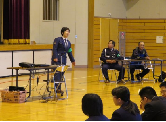
協力して下さった能代警察署のみなさま

能代警察署の方々に全面的に協力していただき、不審者役の警察の方が校舎内に入れずにうろうろしているところを駆けつけた二ツ井交番の警察官が確保する、というところまでやっていただきました。