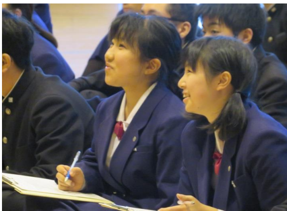
「いかのおすし」の意味は？

また、知らない人と話すときは、すぐに手を捕まれない距離を保ち、危なくなったらなるべく人が多くいる場所に逃げ込むことが大切です。今回学んだことを忘れず、「自分の身は自分で守る」ことができるようにしましょう。