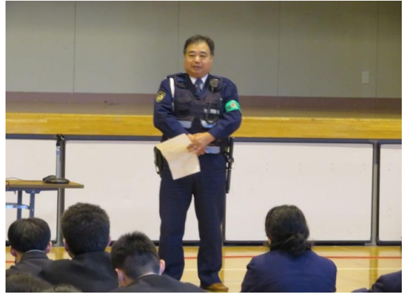
不審者から身を守るために

訓練の後は体育館に集合し、警察署の方から不審者から身を守るためにとるべき行動について説明していただきました。