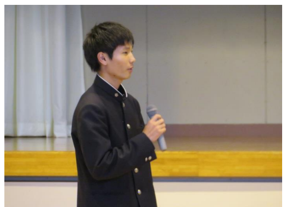
生徒代表お礼の言葉