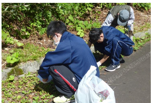
オオバコの駆除（2年）