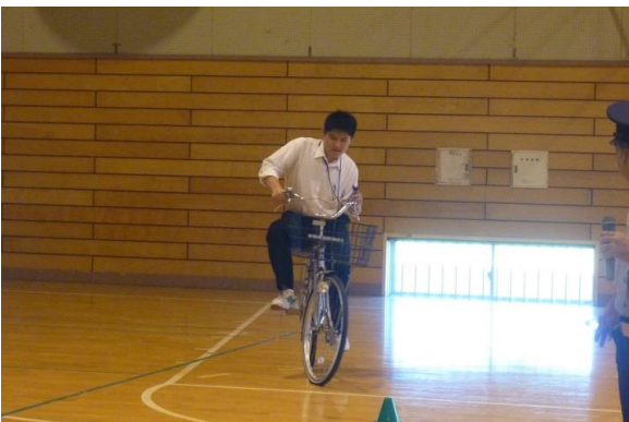
ながらスマホは、自転車の運転操作が不安定でバランスを崩します