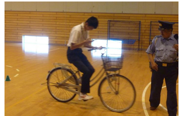
警官が前方にいるのに気づきません

高校生は、自転車で事故を起こすと刑事上の責任で「過失運転致死」の罪に問われます。また、民事上の責任として高額な賠償金を払わなければなりません。