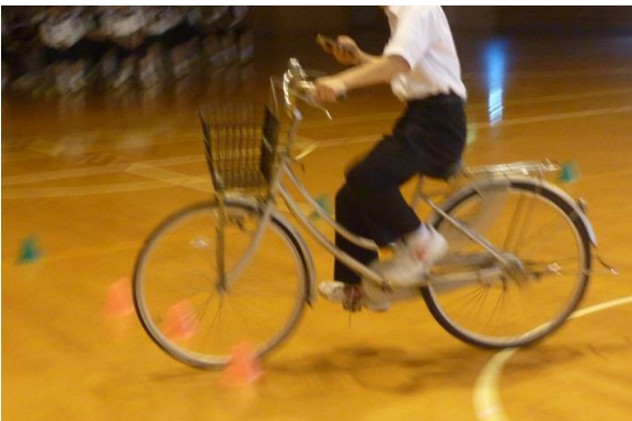
赤いコーンは歩行者を想定しています