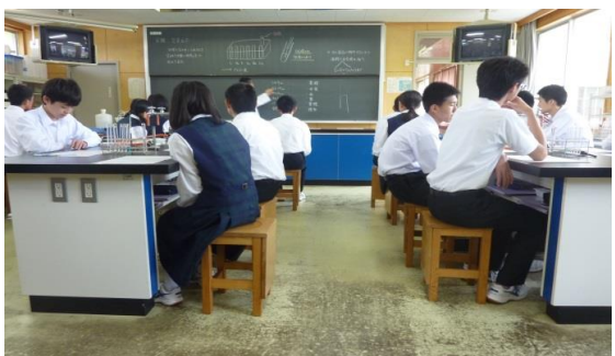
中には色がはっきりでる物質があったなあ