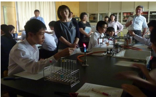
どんな色になるのか実験を順番に行います