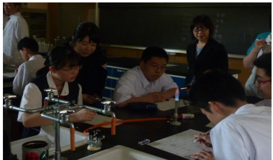
物質名と色を線で結びます

・どのグループも協力して実験ができていました。面談でもこの3ヶ月での成長を感じ嬉しく思います。