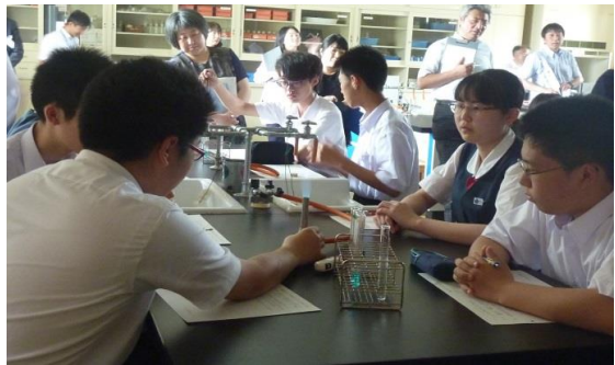
久しぶりに会う中学校の先生 緊張するなあ