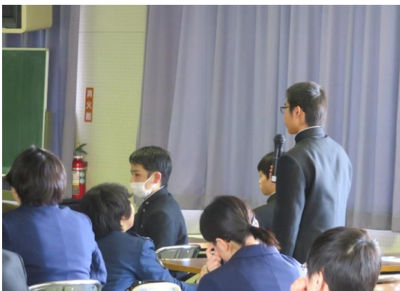
なぜトラブルになったのか？考えを述べる。②

生徒の皆さんは今日の携帯安全教室で学んだことを生かし、安全な高校生活を送ってほしいと思います。