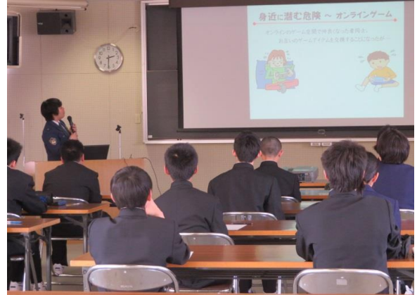
スライドを使い、説明