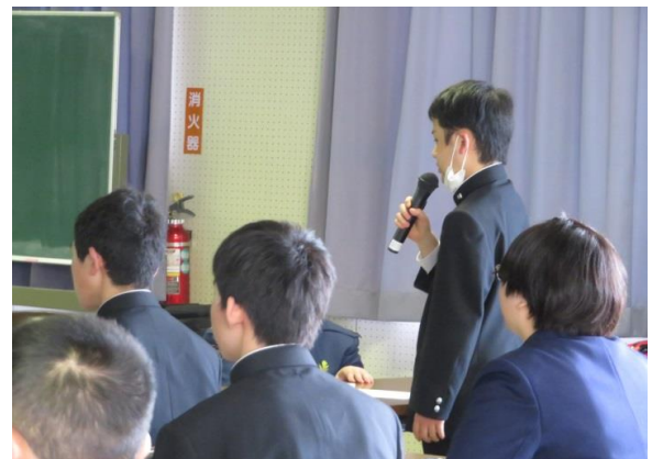
なぜトラブルになったのか？考えを述べる。①

さらに、メッセージ（文字）のやりとりと投稿に関しては、「文字だけではネガティブな印象を与えやすい。」「お互いに顔を合わせて言葉を発して意思疎通を図ることが大切。」と話されました。