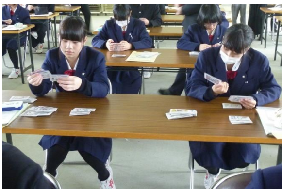
職業カードを使ったワーク

空欄に入るのは 40.9% ！ 卒業3年後には半数近い人が離職してしまっている!?