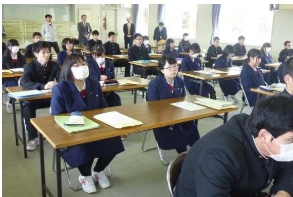
2年生は全員が参加

高卒就職者の早期離職の割合が高いことが社会問題化しているということはこれまでに何度も耳にしましたが、実際に離職した人に聞いたところ、「仕事が自分の思っていたものとは違って」「仕事内容が自分に合わなかった」という声が多いのだそうです。