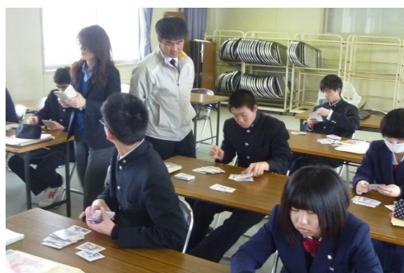
やりたい仕事とそうでない仕事に分ける。すると…

自分に合った仕事、ずっと続けていける仕事を選ぶには、まずは自分自身を知らなければなりません。当たり前のことではありますが、永井先生のお話とワークを通して、より強く意識させられました。