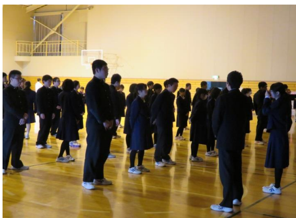
すぐに手を捕まれない距離

また、知らない人と話すときは、すぐに手を捕まれない距離を保ち、危なくなったらなるべく人が多くいる場所に逃げ込むことが大切です。今回学んだことを忘れず、自分の身は自分で守ることができるようにしましょう。