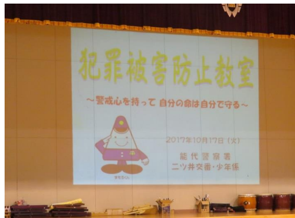
不審者から身を守るために

訓練の後は体育館に集合し、警察署の方から不審者から身を守るためにとるべき行動について説明していただきました。