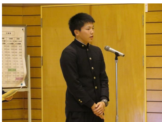
生徒代表お礼の言葉