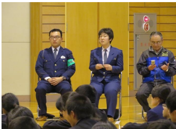
協力して下さった能代警察署のみなさま

能代警察署の方々に全面的に協力していただき、不審者役の警察の方が校舎内に入れずにうろうろしているところを駆けつけた二ツ井交番の警察官が確保する、というところまでやっていただきました。